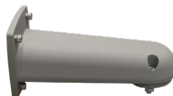
BRAZO PARA MURO HZCASMARM