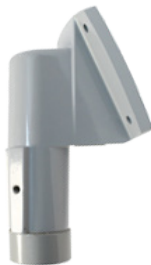
PUNTA DE POSTE 25° CON ADAPTADOR ROSCADO HZCAS25SUPPORT