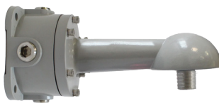
BRAZO PARA MURO A 90° HZCAS90ARMJBOX